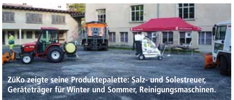
ZüKo zeigte seine Produktpalette: Salz- und Solestreuer, Geräteträger für Winter und Sommer, Reinigungsmaschinen.