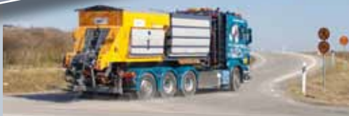
...und Epoke Sirius-Kombi für Trockenstoff und Sole