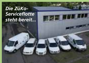
Die ZüKo-Serviceflotte steht bereit...

Benelux Eismaschinen Relco B.V Theo van Vegten Rechte Tocht 9-F NL-1507 BZ Zaandam Tel. 0031 075 612 41 40 Fax 075 612 41 50