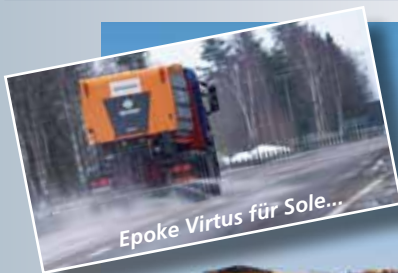
Epoke Virtus für Sole...

Individuell auf jeden LKW zugeschnittene Lösungen garantieren einen problemlosen Einsatz auch im härtesten Winter. Die hohe Stabilität des Epoke-Behälters begünstigt den Aufbau enorm.